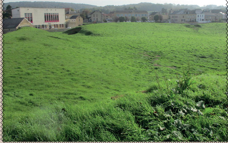
Vue de la salle des fêtes depuis une tour

A la fin du 14 ème siècle, la terre de Lumes et les droits établis sont partagés entre WILLE de Lumes et PIERRE de LUMES mais la succession est très disputée.