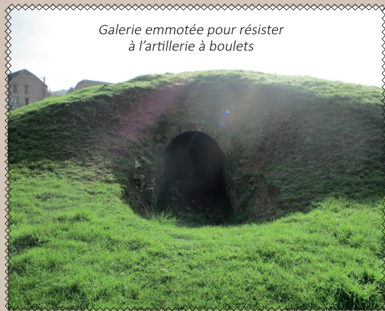
Galerie emmotée pour résister à l'artillerie à boulets

Pourtant en 1567, MALBERG fait ses hommages au roi de France. Le château de Lumes occupe une position stratégique, se trouvant à la frontière de 2 royaumes.