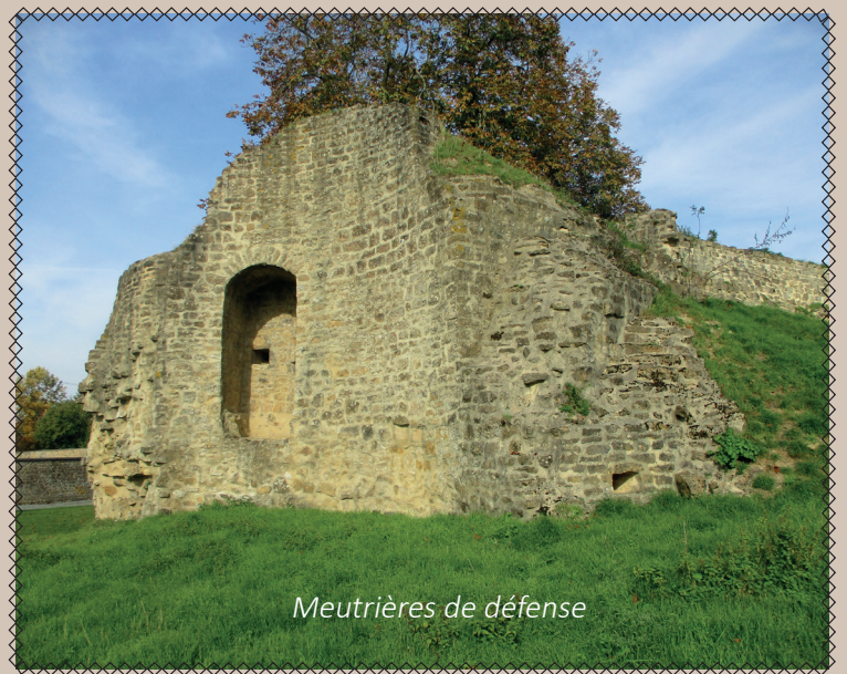
Meutrières de défense

La maréchale de LA MARCK récupère le célèbre et convoité butin de JEAN II et emmène les 60 chariots à Sedan.