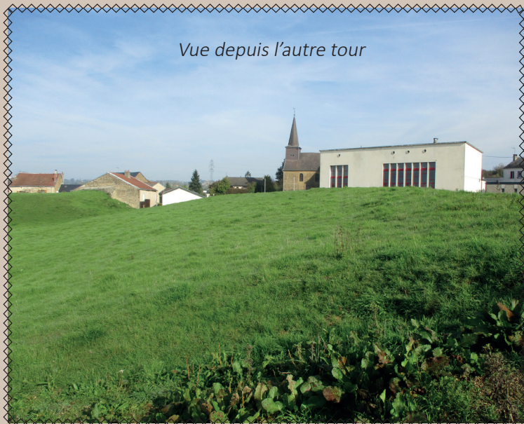
Vue depuis l'autre tour